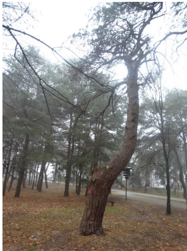
Poz. nr, sosna, 225 cm, dz. nr 237/6, Wola Uhruska.