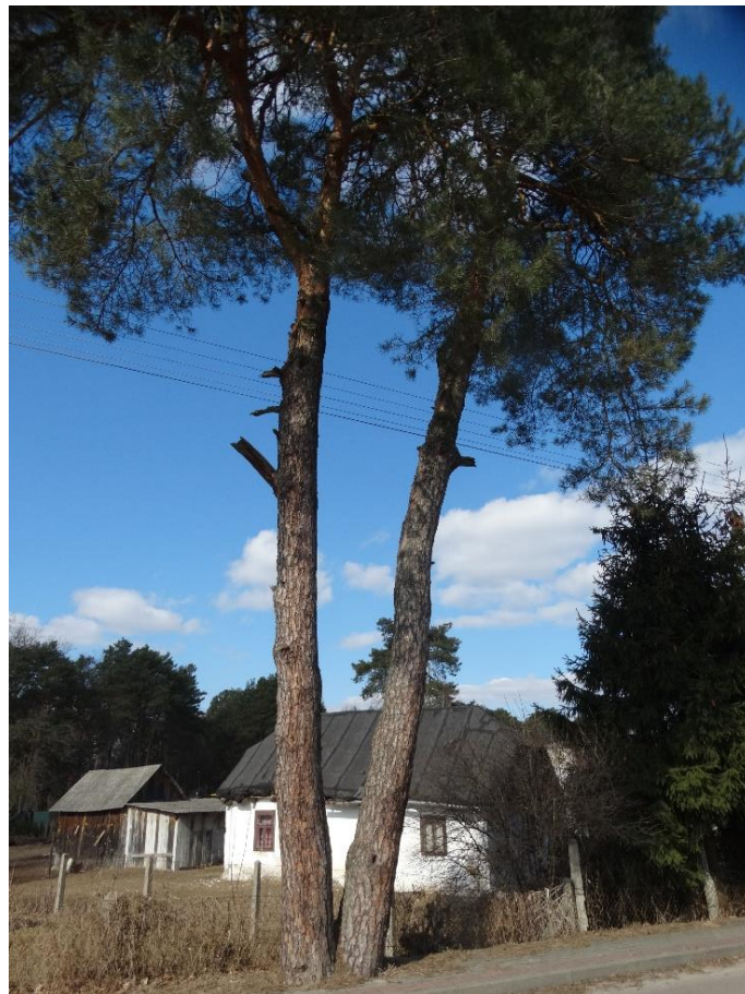
Poz. nr 3, sosna, 168 cm, sosna 155 cm, dz. nr 985/4, Wola Uhruska (ul. Dworcowa).