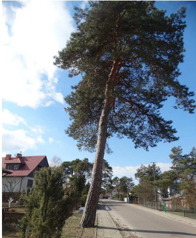
Poz. nr 2, sosna, 200 cm, dz. nr 985/4 Wola Uhruska (ul. Dworcowa).