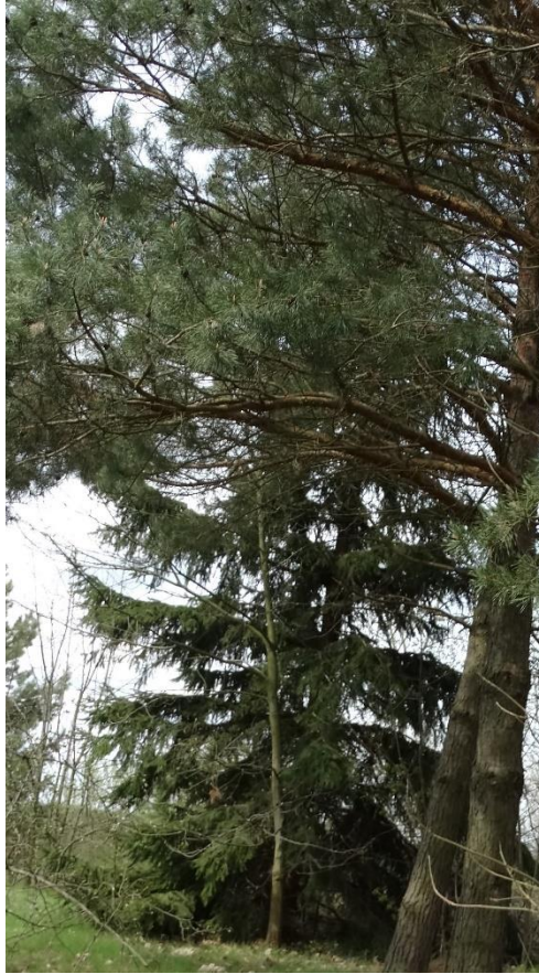
Poz. nr 10, świerk, 76 cm, dz. nr 333/1, Siedliszcze.