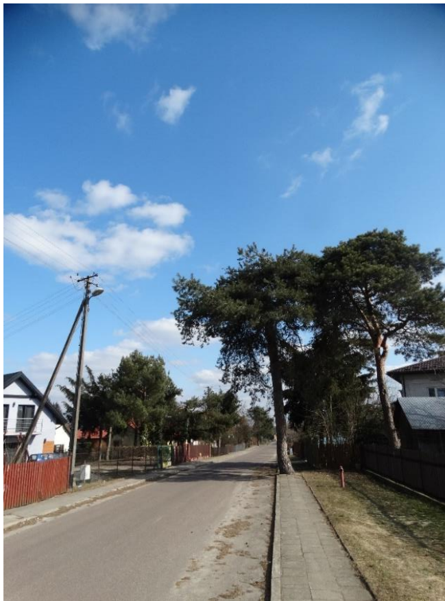
Poz. nr 2, sosna 188, cm, dz. Nr 985/2, Wola Uhruska (ul. Dworcowa).