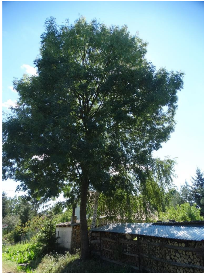
Poz. nr 16, jesion, 198 cm, dz. nr 382, Siedliszcze.