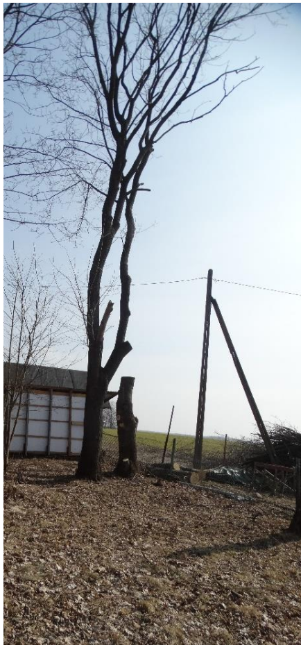
Poz. nr 11, klon, 110 cm, dz. nr 288, Siedliszcze.