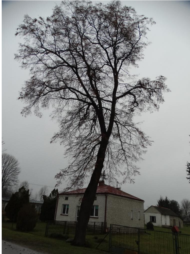
Poz. nr 12, lipa, 240 cm, dz. nr. 131, Siedliszcze.