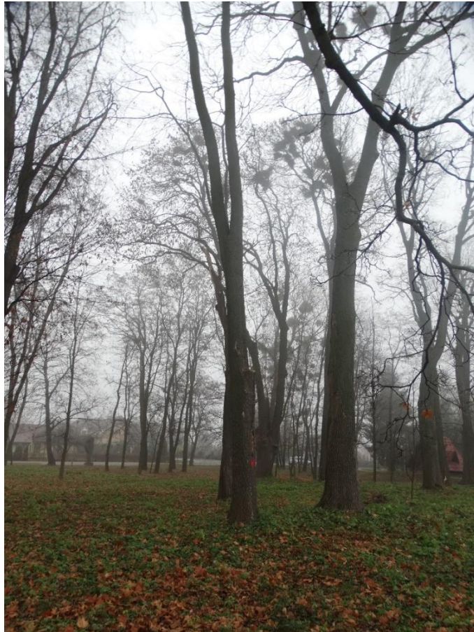
Poz. nr 5, robinia akacjowa 186 cm, robinia akacjowa, 200 cm, dz. nr 237/21, Wola Uhruska.