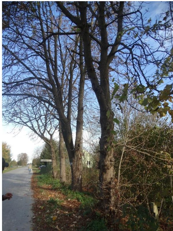
Poz. nr 13, kasztanowiec 155 cm, kasztanowiec 140 cm, kasztanowiec 190 cm, kasztanowiec 141 cm, dz. nr 132, Poz. nr 14, jesion, 245 cm, dz.nr 73, Kosyń.