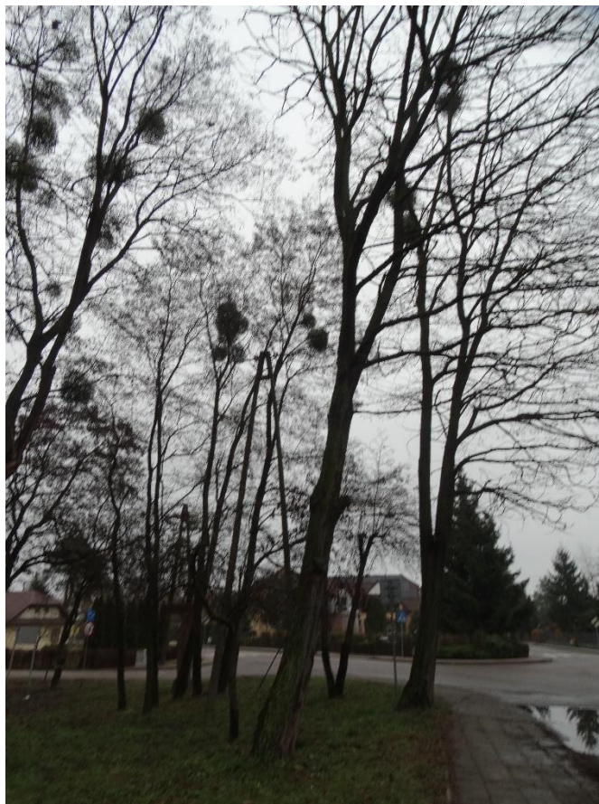
Poz. nr 5, robinia akacjowa, 143 cm, dz. nr 237/21, Wola Uhruska.