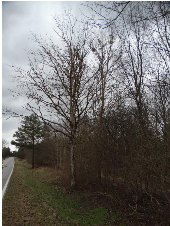
Poz. nr 14, topola, 100 cm, dz. nr 387, Zbereże.