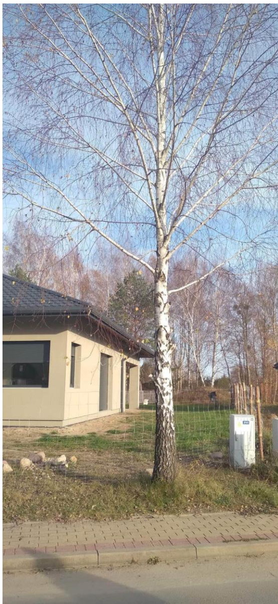
Poz. nr 9, brzoza, 77 cm, dz. nr 1292, Wola Uhruska.