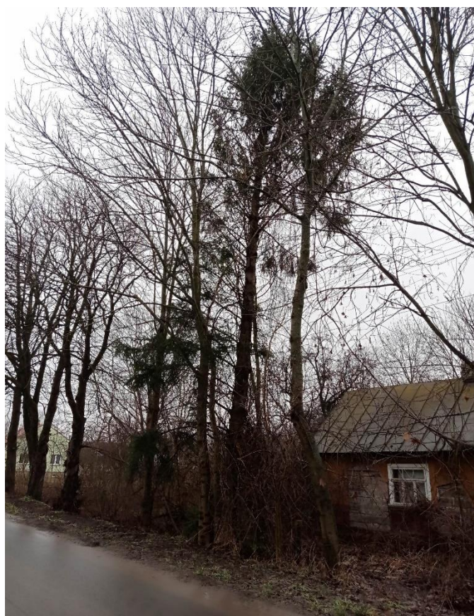
Poz. nr 13, świerk 160 cm, klon 185 cm, dz. nr 132, Siedliszcze.