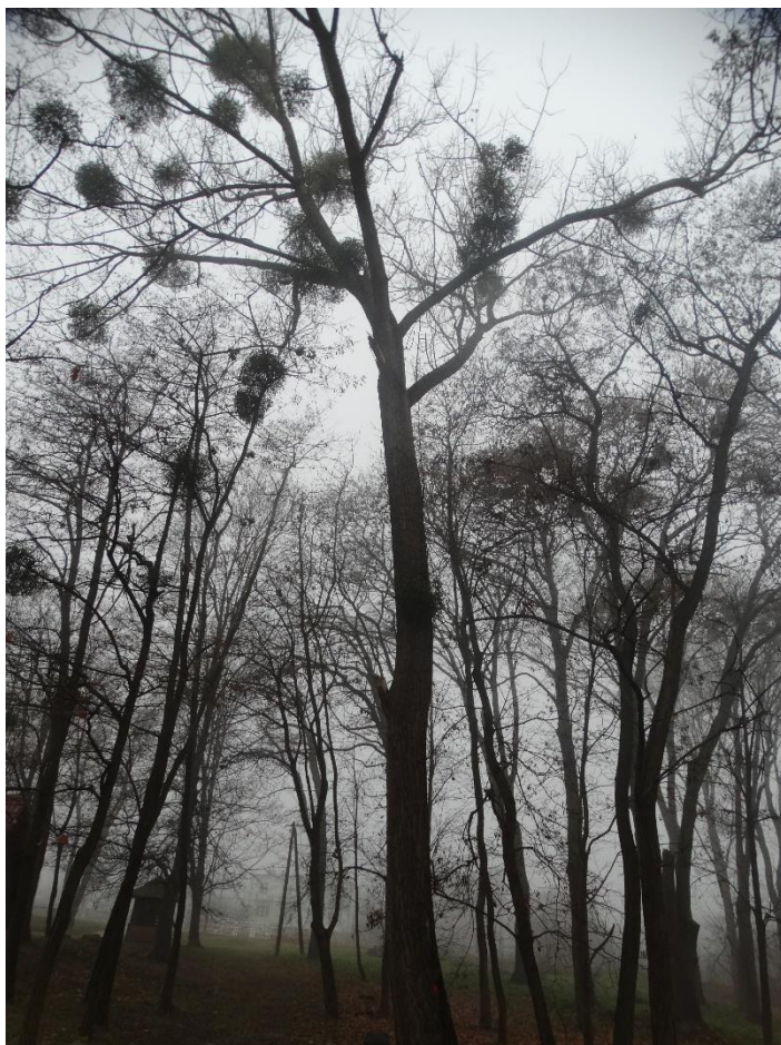
Poz. nr 5, topola, 245 cm, dz. nr 237/21, Wola Uhruska.