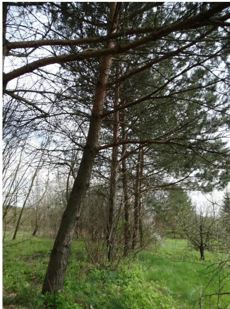
Poz. nr 10, dz. sosna, 76 cm, sosna 91 cm, sosna 75 cm, sosna 80 cm, sosna 82 cm, sosna 79 cm, nr 333/1, Siedliszcze.