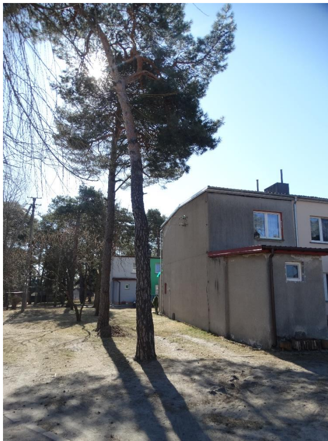
Poz. nr. 7, sosna, 146 cm, dz. nr 210/2, Wola Uhruska (Al. Odrodzenia).