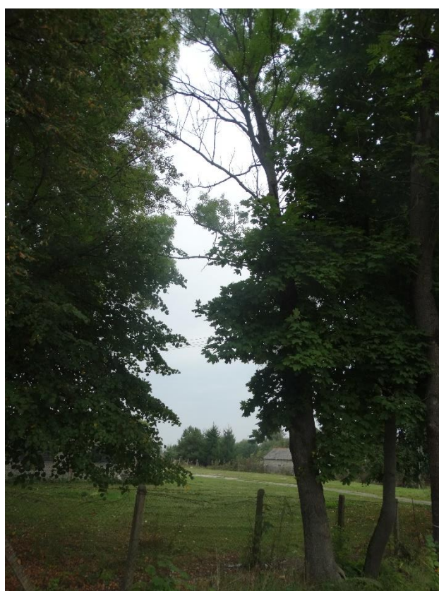
Poz. nr 12, jesion, 150 cm, nr dz. 131, Siedliszcze.