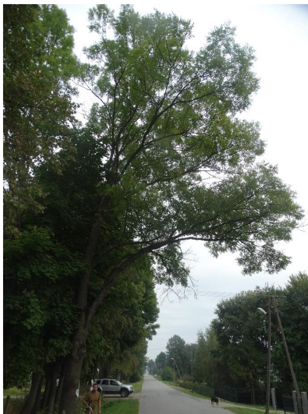
Poz. nr 12, jesion, 171 cm, dz. nr. 131, Siedliszcze.