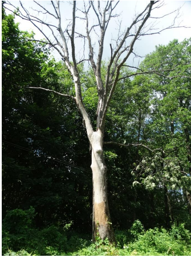
Poz. nr 15, jesion, 245 cm, dz. nr 73, Kosyń.