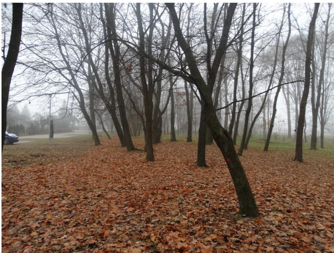
Poz. nr 4, klon, 90 cm, dz. nr 237/6, Wola Uhruska.