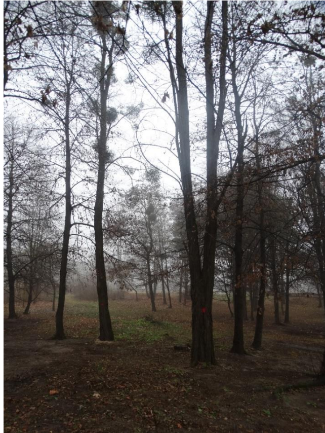
Poz. nr 4, robinia akacjowa 124 cm, robinia akacjowa 174 cm, dz. nr 237/6, Wola Uhruska.