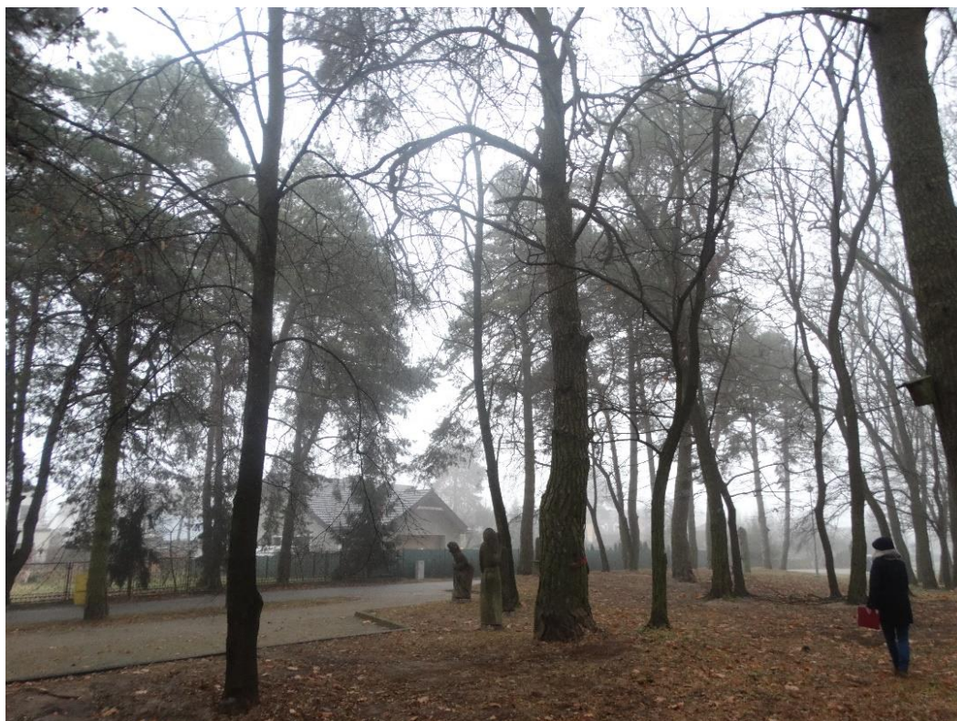
Poz. nr 4, sosna, 230 cm, dz. nr 237/6, Wola Uhruska.