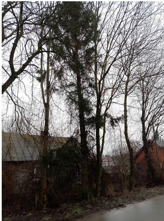
Poz. nr 13, jesion 80 cm, jesion 75 cm, jesion 50 cm, jesion 86 cm,, dz. nr 132, Siedliszcze.