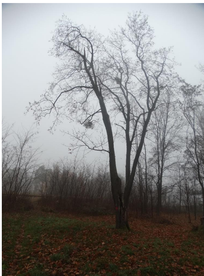
Poz. nr 5, klon, 204 cm, dz. nr 237/21, Wola Uhruska.