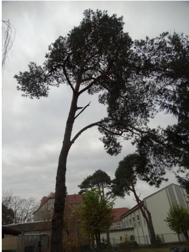
Poz. nr 1, sosna, 101 cm, dz. nr 353, Wola Uhruska.