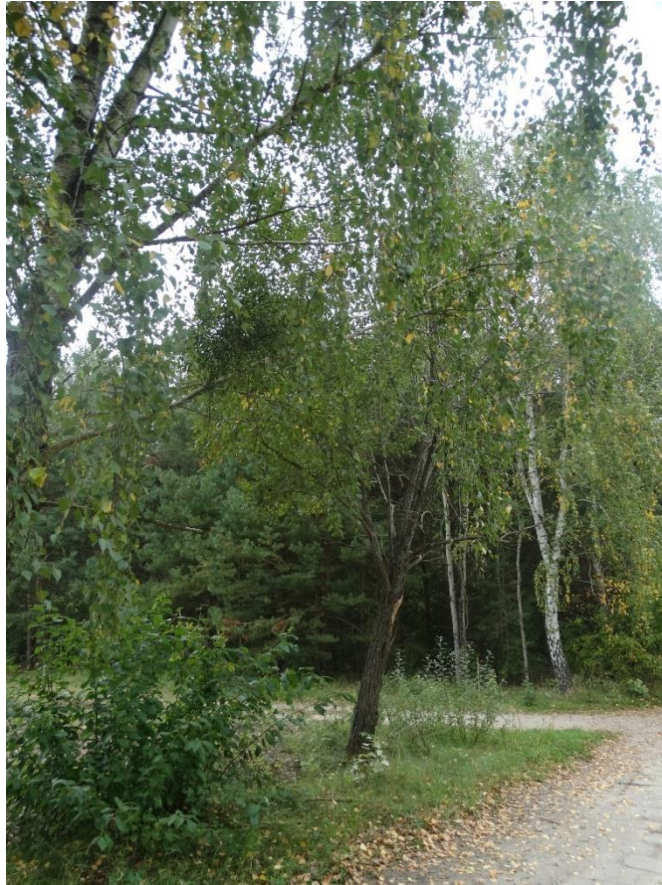
Poz. nr 6, wierzba, 85 cm, dz. nr 1089, Wola Uhruska.