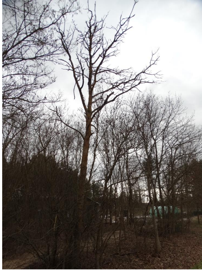
Poz. nr 14, topola, 120 cm, dz. nr 387, Zbereże.