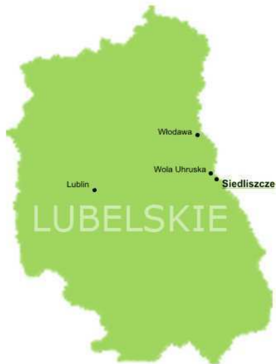
Wieś Siedliszcze w województwie lubelskim

Miejscowość Siedliszcze leży u podnóża Łuku Uhruskiego, na jego południowo-wschodnim krańcu, przy szlaku nadbużańskim u ujścia rzeki Uherka do Bugu. Jej współrzędne geograficzne to N: 51° 17'57,67" i E: 23° 38'45,14". Administracyjnie Siedliszcze należy do gminy Wola Uhruska przynależnej do powiatu włodawskiego w województwie lubelskim.