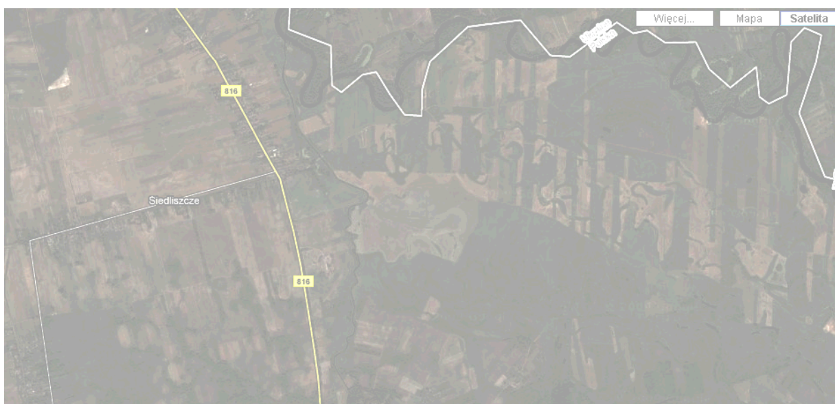
Zdjęcie satelitarne meandrującej rz. Bug w okolicy Siedliszcze

Część Siedliszcza - Stara Wieś rozciąga się wzdłuż granicznej rzeki Bug. Rzeka z jej naturalnym charakterem brzegów i tajemniczością najbliższej okolicy stanowi wyjątek w skali europejskiej. Liczne starorzecza i użytki przyrodnicze powstałe na skutek meandrującego nurtu i nieregularnego koryta rzeki są doskonale widoczne na zdjęciach satelitarnych.